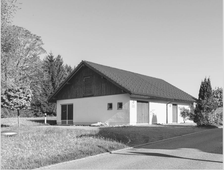
Pumpstation Breitschachen ▲