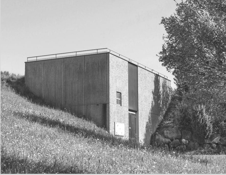
▲ Reservoir Meldegg