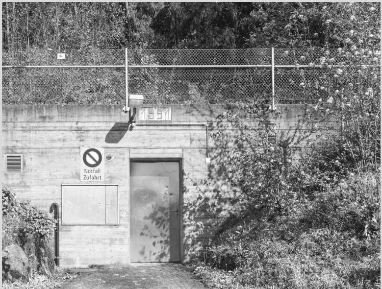
▼ Reservoir Weid